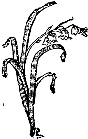
एक सौ अट्टावन

इधर पंडितजी तथा उनकी दोनों पत्निया भी चुप नहीं बैठी थीं । उन्होंने भी अपनी नयी शिक्षा-पद्धतिके अनुसार सिर्फ उसी ग्रामके नहीं आसपासके अन्य ग्रामोंके बालकोंको भी अक्षर ज्ञानके साथ-साथ कई तरहकी औद्योगिक शिक्षा देनेका काम जारी कर रखा था । जिसके फलस्वरूप इन ढाई-तीन सालके भीतर ही वहाँसे कई अच्छे लड़के बढ़ई और लुहारका काम सीखकर अपनी रोजी कमानेके योग्य बनकर अपने गावोंको लौट गये थे ।